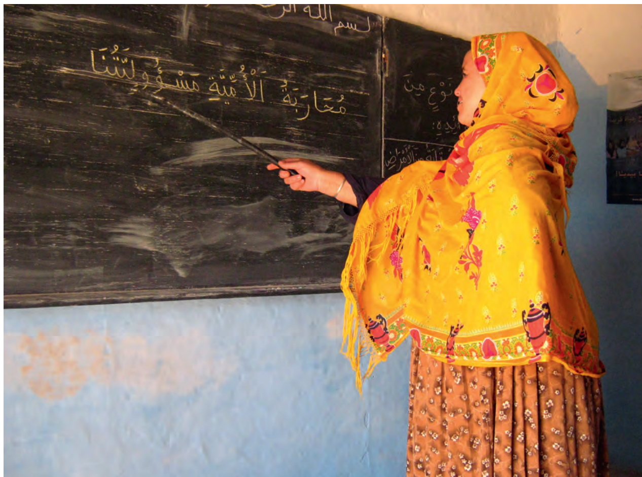
Participante du Programme marocain d'alphabétisation fonctionnelle des femmes de la coopérative Argan

connaissances, compétences, technologies et valeurs. Tout en reconnaissant la nécessité de la parité à l'école, les approches transformatrices de l'autonomisation des femmes vont au-delà des institutions et programmes éducatifs formels et s'intéressent aux différents modes d'apprentissage des femmes, notamment à travers les médias, l'organisation sociale, la migration et le travail. Cette section analyse les implications d'une approche de l'ALE axée sur le développement durable et