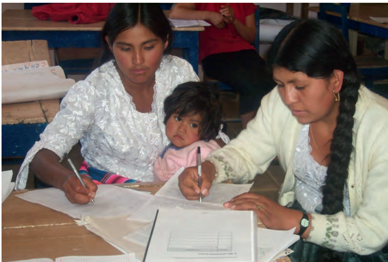
Projet d'alphabétisation bilingue en matière de santé reproductive, dirigé par le ministère de l'Éducation, de la Culture et des Sports de la Bolivie

alphabétisation et d'insertion des femmes de l'ONG Association algérienne d'alphabétisation (IQRAA) aide les femmes à s'émanciper en obtenant une qualification et a négocié la reconnaissance de leur certificat d'alphabétisation par le ministère de la Formation professionnelle. Au Brésil, le ministère de l'Éducation a adopté une approche alternative, avec son Programme national d'éducation des adultes et des jeunes qui intègre une qualification sociale et professionnelle. En effet, c'est de l'intérieur du système éducatif formel qu'il bouscule la dichotomie historique entre éducation de base et formation professionnelle et redonne la priorité à l'agriculture familiale en s'inspirant de l'approche de Freire et de la notion du travail comme pratique sociale.