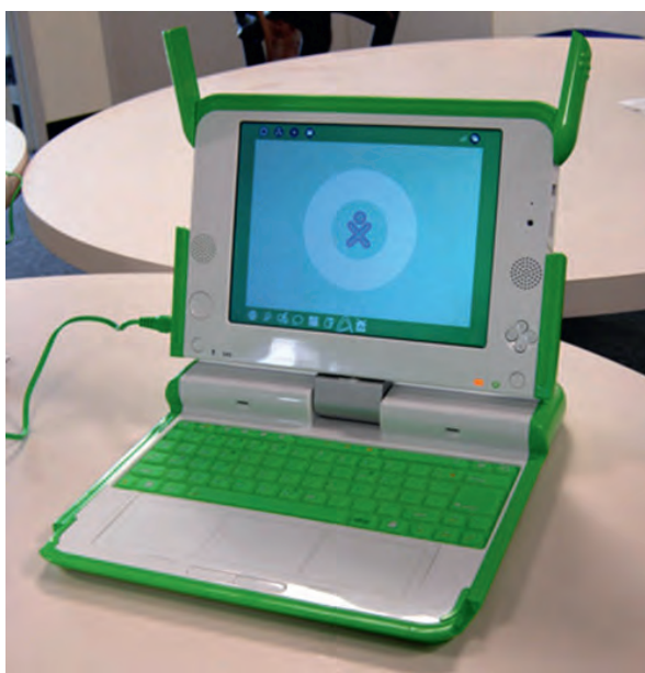
Ordinateurs XO utilisés au Kenya pour autonomiser les groupes d'entraide à travers les TIC en leur permettant d'exercer des activités de subsistance alternatives

communautés à préserver l'environnement marin à travers des « unités de formation communautaire interactive axée sur l'alphabétisation et l'environnement ». En partenariat avec Avallain, une entreprise sociale suisse spécialisée en apprentissage et en publication en ligne, le programme a combiné questions environnementales et compétences de