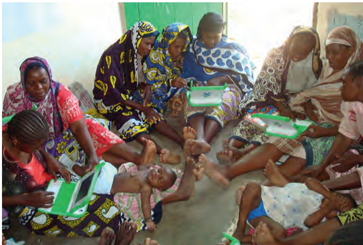
Femmes kényanes étudiant la préservation des milieux marins à l'aide d'ordinateurs XO

cibler les femmes en tant que groupe homogène. Aujourd'hui, il est largement admis que « l'autonomisation a différentes significations selon les différentes situations des femmes » (UIL 2014, p. 3) et qu'à elle seule l'éducation suffit rarement à générer un tel changement social et politique. Toutefois, la tendance à concevoir « l'autonomisation des femmes » comme un résultat au lieu