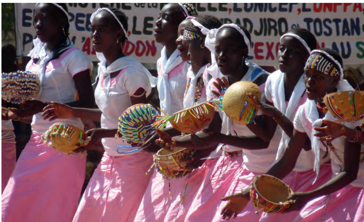
Le Programme d'autonomisation de la communauté, dirigé par l'ONG Tostan, a recours aux danses et chants traditionnels d'Afrique

femme et les hiérarchies entre les sexes. L'activité de changement social des programmes d'alphabétisation des femmes porte souvent sur l'éducation sanitaire, notamment la santé procréative, ou simplement sur l'offre d'un système éducatif alternatif. Le Programme d'alphabétisation fonctionnelle des adultes en santé (AHFLP) de BUNYAD au Pakistan en est un exemple. Outre l'alphabétisation, les métiers, l'entrepreneuriat et les compétences de la vie courante, il propose des cours d'éducation civique, sanitaire et agricole. Le programme a élaboré un curriculum intégrant l'apprentissage en arabe et en urdu pour répondre aux souhaits des parents d'apprendre à leurs filles à lire le Coran. Malgré son volet de développement des compétences professionnelles (telles que la coupe et la couture), son principal objectif est d'aider les jeunes femmes à s'émanciper grâce à la lecture et à l'écriture. Dans une région qui restreint la mobilité de nombreuses filles et s'oppose à leur scolarisation, le programme favorise le changement social par l'alphabétisation tout en s'accommodant des traditions qui refusent que la femme sorte seule (les cours sont organisés près de chez elles) et exigent un contenu religieux.