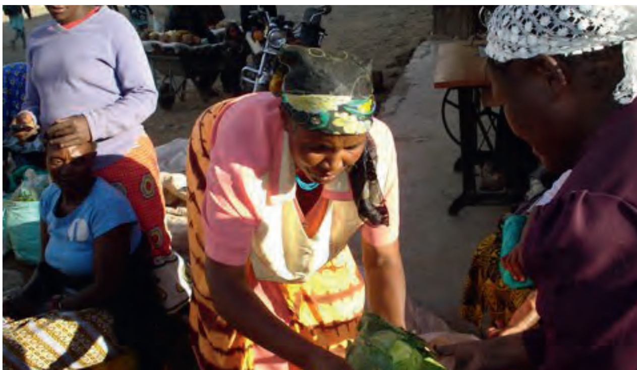
Paysannes qui vendent leurs produits sur le marché local

Contrairement à ces types de projets, tous implantés dans des communautés locales, le projet d'alphabétisation environnementale de NaDEET (Namib Desert Environmental Education Trust) a ouvert un centre d'éducation environnementale dans la Réserve naturelle de NamibRand Hardap, une région du sud de la Namibie. Dirigé par un groupe de défenseurs de l'environnement, le centre offre aux enfants et aux adultes un apprentissage