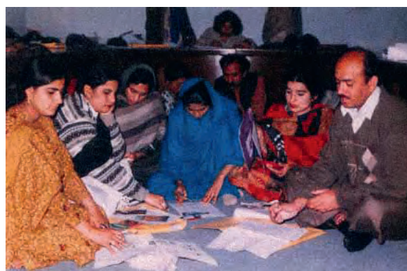
Programme d'alphabétisation fonctionnelle pour la santé des adultes, dirigé par l'organisation BUNYAD au Pakistan

L'alphabétisation est enseignée dans le cadre de la production de divers légumes alors que les participantes apprennent à gérer la dynamique interne du groupe, à s'organiser en équipes, à tenir les comptes, à déposer de l'argent en banque et à commercialiser leurs produits. Pour les familles, ces serres tunnels constituent une source de légumes nourrissants et de revenus. Un des groupes a signé un contrat de fourniture d'épinards avec une grande chaîne de supermarchés sud-africaine.