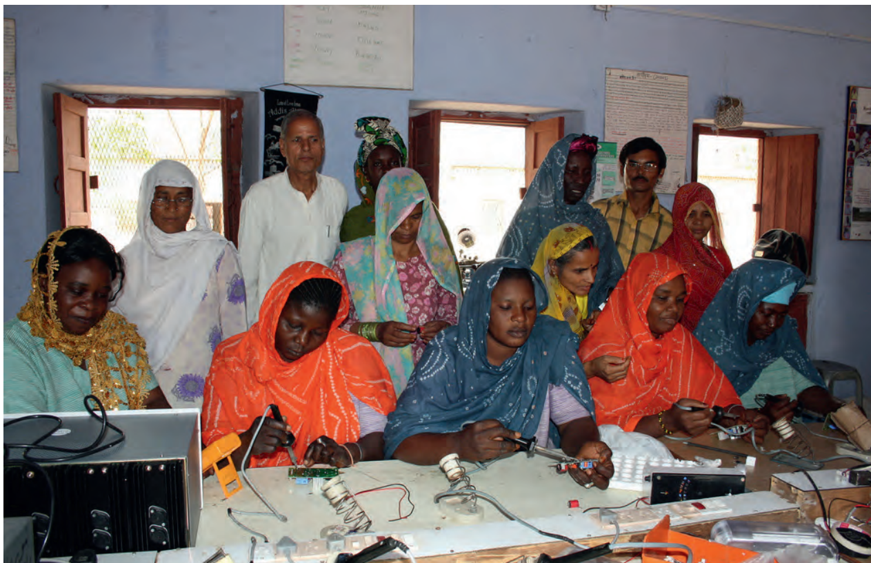
Participant du Programme d'autonomisation de la communauté Tostan au Sénégal

démographique et du changement climatique. Le Groupe de haut niveau sur la viabilité mondiale, initié en août 2010 par le Secrétaire général Ban Ki-moon, a noté que si ce nouveau paradigme de croissance économique, d'égalité sociale et de viabilité environnementale fait une large unanimité, les politiques de développement durable sont restées lettre morte 25 ans après, faute de volonté politique (ONU 2012a, p. 4). Le rapport du Groupe ( Pour l'avenir des hommes et de la planète : choisir la résilience ) souligne également la nécessité de mettre au point un « langage commun pour le développement durable » afin de permettre aux défenseurs des droits sociaux, aux économistes et aux spécialistes de l'environnement de travailler ensemble à placer ces idées au cœur de l'économie (p. 5). Le Groupe souligne que la croissance économique constitue le principal impératif pour le développement durable et l'autonomisation des femmes – devant les deux autres « piliers » (égalité sociale et viabilité environnementale) – et signale le coût de l'exclusion des femmes de l'économie et la nécessité de privilégier leur formation pour résorber le déficit de compétences. Il suggère que « la prochaine progression de la croissance mondiale pourrait bien venir de l'autonomisation économique des femmes » (p. 6). Le rapport es-