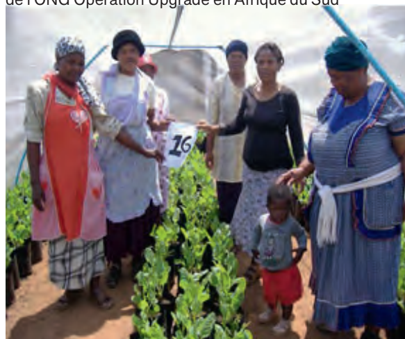
Programme d'« Alphabétisation à travers le jardinage » de l'ONG Operation Upgrade en Afrique du Sud

À l'inverse, le Programme d'alphabétisation et de formation professionnelle des adultes d'Afrique du Sud privilégie l'agriculture et relègue l'alphabétisation au second plan. L'ONG Operation Upgrade, qui cible principalement les femmes de 25 à 50 ans, fournit une serre tunnel maraîchère gérée par une coopérative de 20 apprenantes.