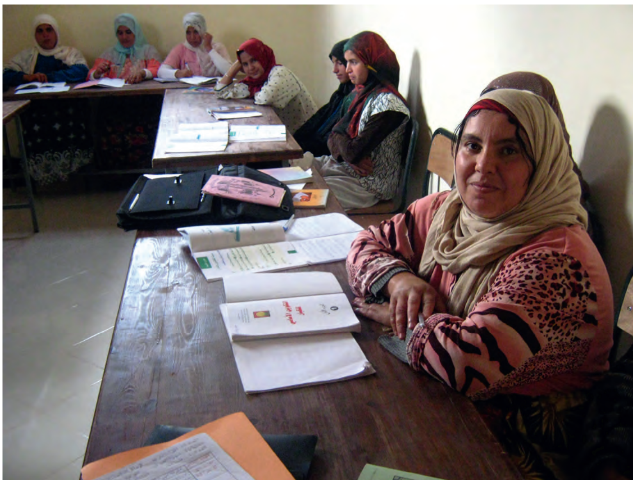
Programme d'alphabétisation fonctionnelle des femmes de la coopérative Argan au Maroc

Le Projet d'alphabétisation fonctionnelle des femmes des coopératives d'argane, initié par l'ONG nationale Association Ibn Albaytar du Maroc, a des origines similaires. Il lutte contre les menaces de l'exploitation économique sur l'environnement et veut « promouvoir et mettre en évidence une relation équilibrée entre l'homme et la nature ». L'arganier, d'où le programme tire son nom, sert de rempart contre l'avancée du désert du Sahara. C'est une source d'huile alimentaire, également utilisée dans l'industrie cosmétique et en médecine traditionnelle. La tradition veut que les femmes travaillent dans le commerce de l'huile d'argane. Le programme a aidé des divorcées ou des veuves à mettre sur pied leur propre coopérative. Il a conçu un nouveau curriculum d'alphabétisation en amazigh, langue berbère parlée par les femmes, alliant compétences pratiques en gestion de coopérative (dont la connaissance de la législation) et sensibilisation à l'importance de préserver l'arganeraie. Le projet a appris aux femmes le nouveau code de la famille, en particulier les lois relatives au statut des divorcées. Il combine les trois dimensions du