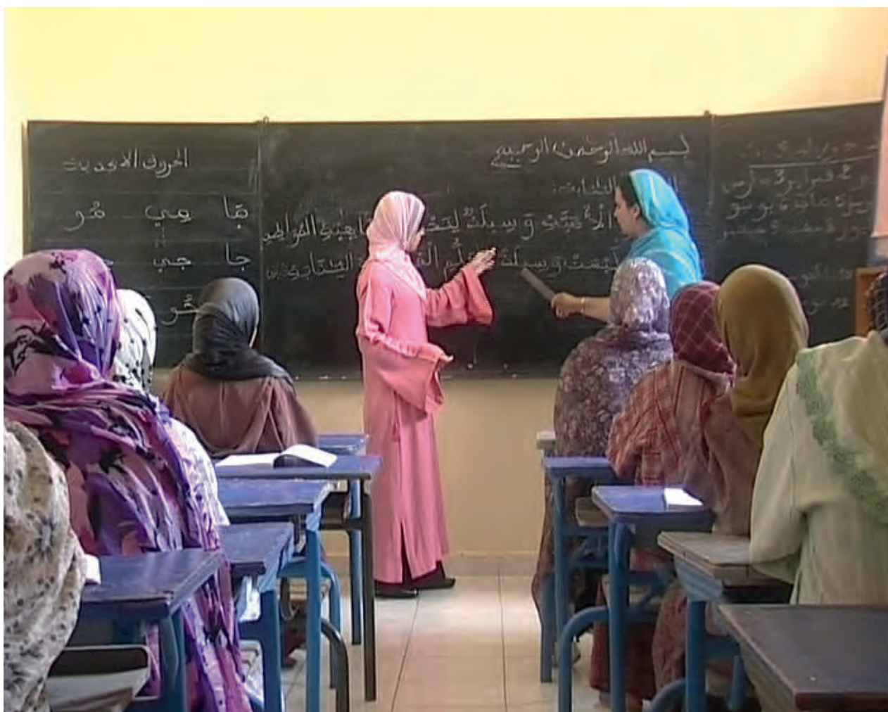
Femmes de la coopérative Argan étudiant les menaces actuelles que l'exploitation économique fait peser sur l'environnement

la vie courante », laissant entendre qu'il renvoyait à « d'autres dimensions de l'alphabétisation que la lecture, l'écriture et le calcul, comme l'aptitude à résoudre des problèmes, le travail d'équipe, la création de réseaux, la communication, la négociation et la réflexion critique ». Un séminaire organisé récemment (juin 2014) à Hambourg par le Conseil international d'éducation des adultes et l'Institut de l'UNESCO pour l'apprentissage tout au long de la vie a conclu que le concept était mieux défini par les quatre piliers de Delors, qui consistent à apprendre à être, à savoir, à faire et à vivre ensemble (UNESCO 1996). Du fait du caractère central des termes « alphabétisation » et « compétences de la vie courante » dans le discours de la politique d'EDD, ces définitions changeantes doivent être prises en compte en examinant de quelle façon l'alphabétisation des femmes peut faciliter les processus d'autonomisation.